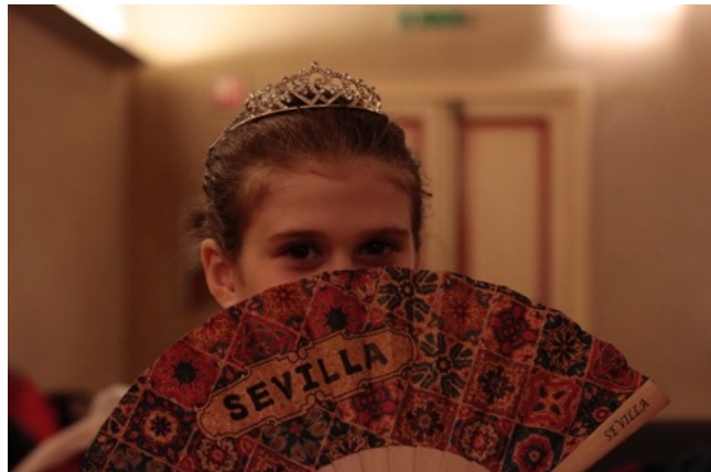
Viaggiatori Dispersi – spettacoli di fine anno degli allievi di teatro Correggio