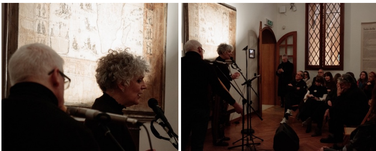
Antigone/Antigona - spettacolo esito del gemellaggio internazionale con Sofia